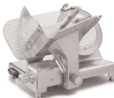
SUPRA 300P / 350CP / 350P Finition Silver