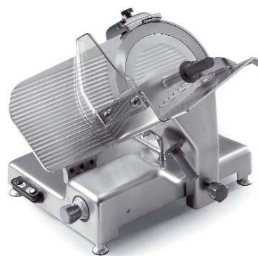
SUPRA 300P / 350CP / 350P Finition standard