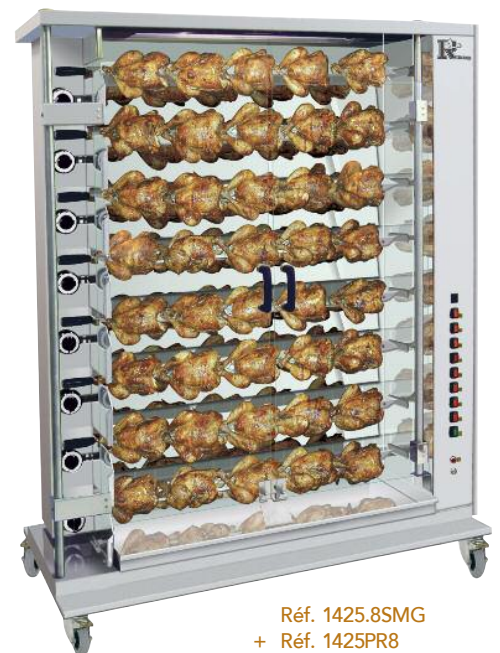
Réf. 1425.8SMG + Réf. 1425PR8

The 8 spit electric version (ref : 1655.8SME, 1425.8SME and 1175.8SME) for large quantities, these units are heated by only 2 separate heating areas (2x4 spits). For all other models the each spit area can be heated individually.