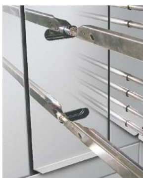
Double paroi démontable Removable double wall