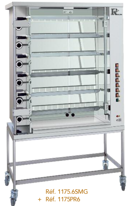
Réf. 1175.6SMG + Réf. 1175PR6

Carrosserie inox, équipé de moteurs flottants, réglables, indépendants par broches. Vitres de protection K.GLASS avec blocage à l'ouverture et à la fermeture. Compartiments techniques protégés de la graisse de cuisson et chaleur (haute température) par une double paroi démontable. Livrée avec broches cuisanpics (Réf. CUI..., voir accessoires p19). Paraboles inox démontables entre les éléments de chauffe. Stainless steel, equipped with individual motors and adjustable drive to spit easily. Equipped with K.GLASS glass doors with locking system whilst opened or closed. Removable stainless steel panels in-between heating elements. Delivered with prongless spits (Ref. CUI..., see accessories p19).