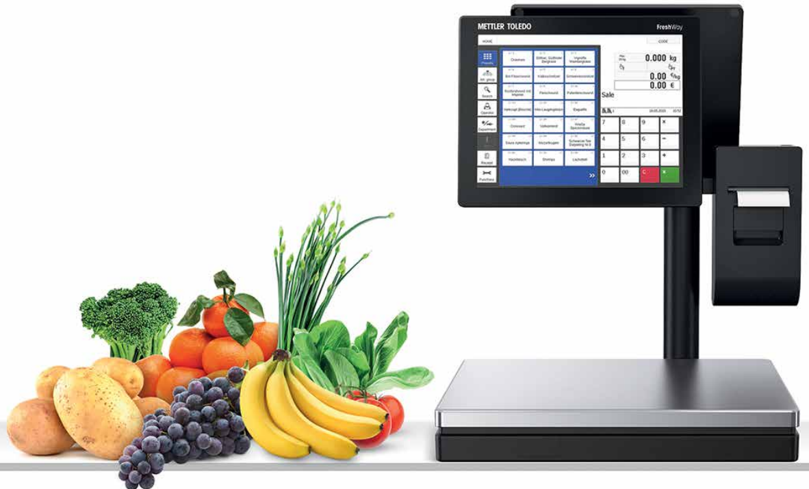
FreshWay avec afficheur sur colonne

FreshWay avec afficheur sur colonne est la nouvelle balance à écran tactile de METTLER TOLEDO. Elle répond aux exigences les plus poussées des commerçants ambitieux. FreshWay T combine un design récompensé avec une performance parfaite et définit de nouvelles normes de pesage et de service au client.